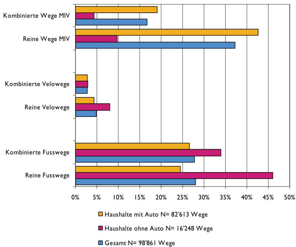
D 3.18: KOMBINIERTE MOBILITÄT (MZV 2005)

Lesehilfe: Ein Weg aus einer Kombination von Fuss- und MIV-Etappen wird doppelt gezählt, sowohl bei den kombinierten Fusswegen als auch bei den kombinierten MIV-Wegen.